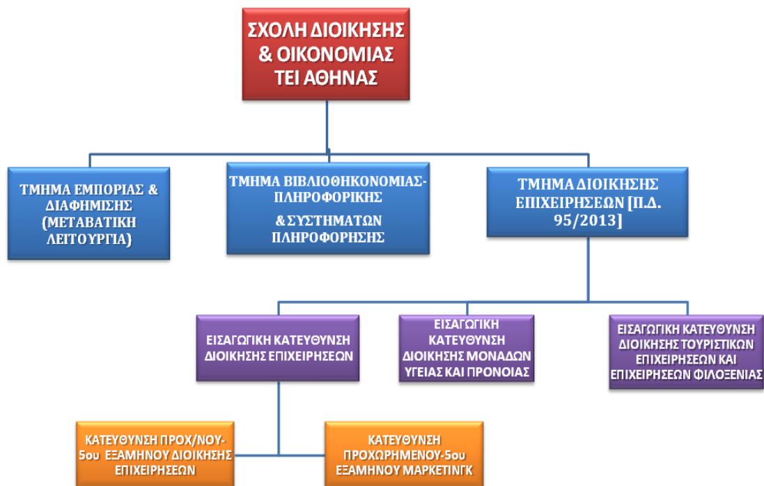
Διάγραμμα 2: Νέα Οργανωτική Δομή ΣΔΟ

Το ακόλουθο Διάγραμμα απεικονίζει τη νέα δομή του Τμήματος στο πλαίσιο της Σχολής Διοίκησης και Οικονομίας (ΣΔΟ) του ΤΕΙ Αθήνας.